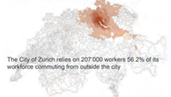
The City of Zurich relies on 207,000 workers 56.2% of its workforce commuting from outside the city